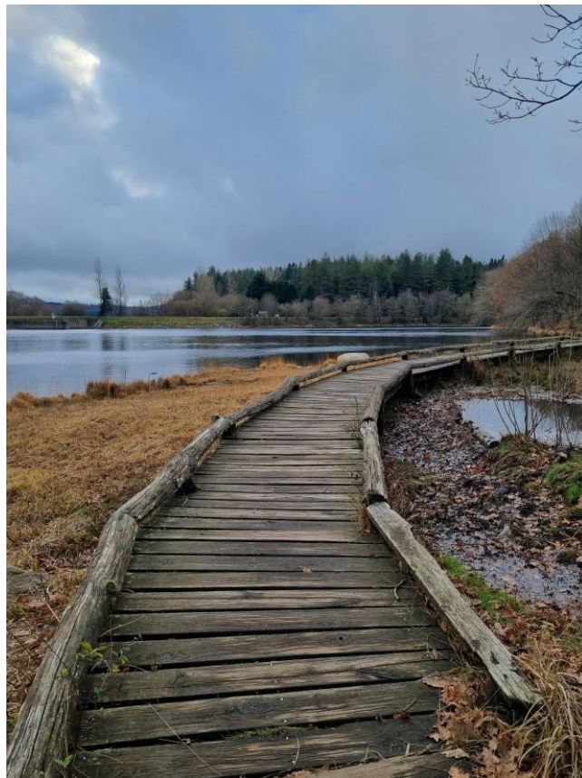
Balade d'Automne à Laprade

Quand l'automne arrive : les feuilles tombent. Les champignons doivent sortir. On doit ramasser ses feuilles. Puis, c'est la saison des pommes et des châtaigniers.