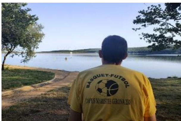
Lac de Laprade

Au programme : pique-nique, balade autour des lacs, cinéma, grillade en soirée, et pétanque.