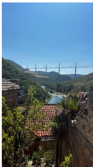
Pont de Millau

Un groupe est parti en séjour dans l'Aveyron, au centre de vacances Valrance à St Sernin sur Rance, avec visites guidées aux caves de Roquefort, visite d'une exposition de peinture et le pont de Millau.